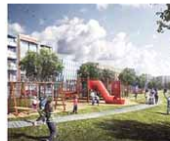
ДЕТСКИЙ САД НА 500 МЕСТ ШКОЛА НА 1200 МЕСТ СПОРТИВНЫЙ КОМПЛЕКС И СТАДИОН